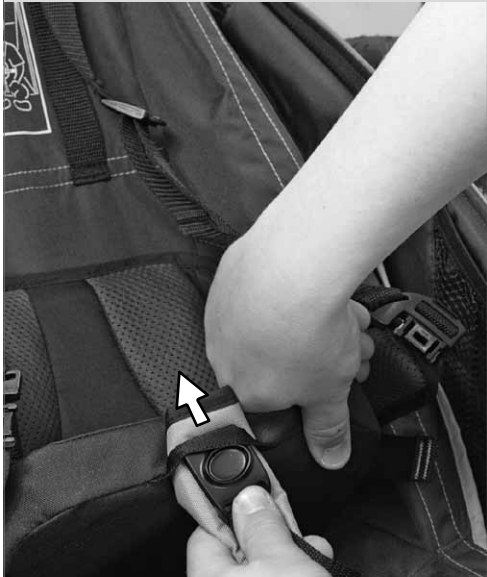
Croozer 2016-2017 → 20