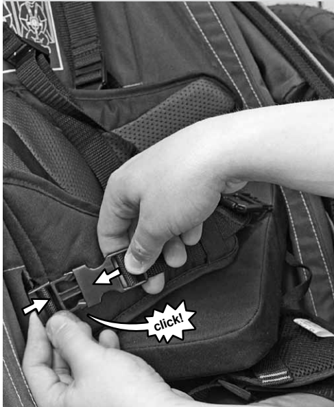
rechts/right/à droite + links/left/à gauche